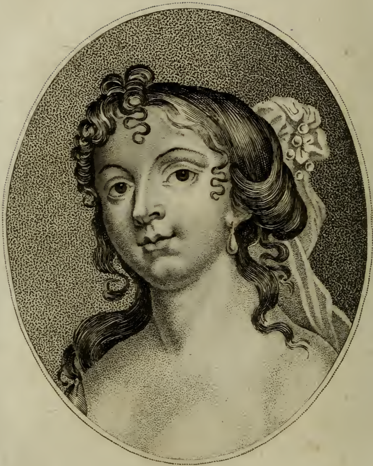
Mademoiselle Hamilton COMTESSE DE GRAMMONT.